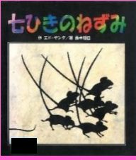
エド・ヤング/作 古今社

人形劇『七ひきのねずみ』や絵本の読み聞かせなど、楽しいプログラムが盛りだくさん！ 読み手 図書館読書ボランティア「おはなしアライグマ」 人形劇に参加すると、プレゼントがもらえる！ ★おはなし会カードは各回でシール2枚もらえるよ！